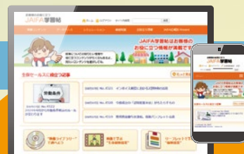
ホーム画面イメージ

ログイン画面からアクセス！ ※アクセスコードは広報誌Present最新号をご確認ください。