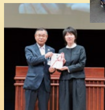
「NPO法人ジャパンハート」贈呈式