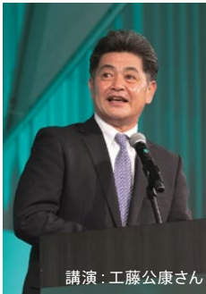
講演：工藤公康さん

年次統一セミナー（通称年次大会）として、年に一度、統一テーマを 設けて全国規模のセミナーを開催。著名人による講演、趣向を凝らし たアトラクションのほか、各地名産のエキシビションブースも設置。 一般の方を含め、毎年5,000名以上の方に参加いただいています。