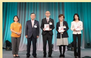
創設60周年記念大会贈呈式