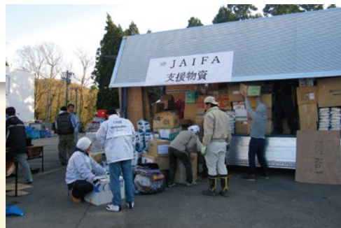
東日本大震災時には、被災地へ支援物資を届けに回らせていただいた。

会員の年会費には、ファンデーション基金が含まれており、各地での災害時や未来ある子どもたちのために役立てられています。