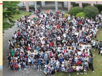
被災地の子どもたちを東京ディズニーランドへ招待